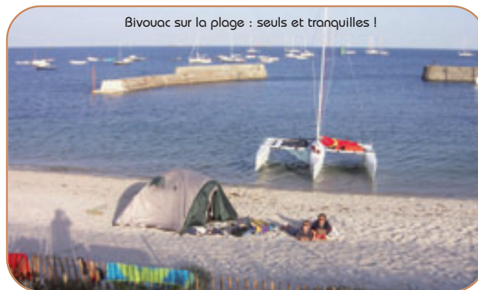
Bivouac sur la plage : seuls et tranquilles !

Nous accélérons le mouvement afin de profiter de la marée haute. Les tentes sont rapidement pliées et le matériel à nouveau embarqué. Nous quittons la plage vers 10 heures et passons les Béniguet profitant du beau temps pour raser les cailloux. Notre but est un tour de Belle-Ile par l'ouest. Le vent de 10 nœuds nous propulse au près à la vitesse de 8 nœuds. Dominique à la barre, nous louvoyons le long des côtes de Belle-Ile laissant successivement Palais et Sauzon à bâbord. Nous