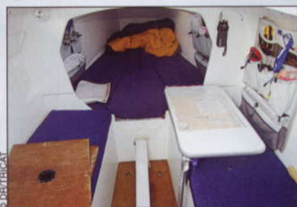
Des emménagements sommaires et efficaces si ce n'était la présence du puits de dérive.

bord ; même si le VMG sera meilleur en s'éloignant un peu. Aux allures plus portantes, sous spi ou gennaker, le 25 tutoie la vitesse du vent. Il trouvera raisonnablement ses limites vers 17-18 nœuds ; au-dessus, la prudence s'impose. Si les emménagements de la version Standard sont handicapés par la présence du puits de dérive central, la version Sport, avec plus de toile (voiles Mylar coupe triradiale) voit les dérives rejoindre les flotteurs. Tout comme le safran, elles sont en carbone « pour une rigidité maximale de ses appendices élancés », ajoute Antoine. Le dixième exemplaire du Tricat 25 vient d'être mis à l'eau. La version de base, dite « Standard Day Boat », permet de disposer d'un bateau (nu à l'intérieur) équipé d'un accastillage Harken, d'une grand-voile et d'un foc en Dacron pour 44500 euros.