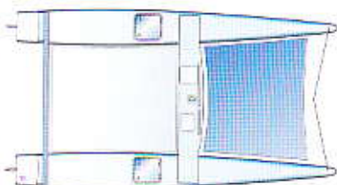
Multi-Raid - Lelièvre/Vignier

NOTRE AVIS. Avec sa plate-forme rigide, une capote et une tente qui couvrent toute la nacelle, le Bicok s'adapte parfaitement à un usage familial, en sortie à la journée ou en raid pour les plus hardis. Maniable et rassurant, il montre un comportement très marin au prix de performances un peu justes dans les petits airs. Les deux coques sont habitables (juste pour dormir ou stocker du matériel). Démontable (comptez une demi-journée pour l'assemblage), il peut se ranger sur une remorque pour l'hiver. ■ Comparatif VV n° 458.